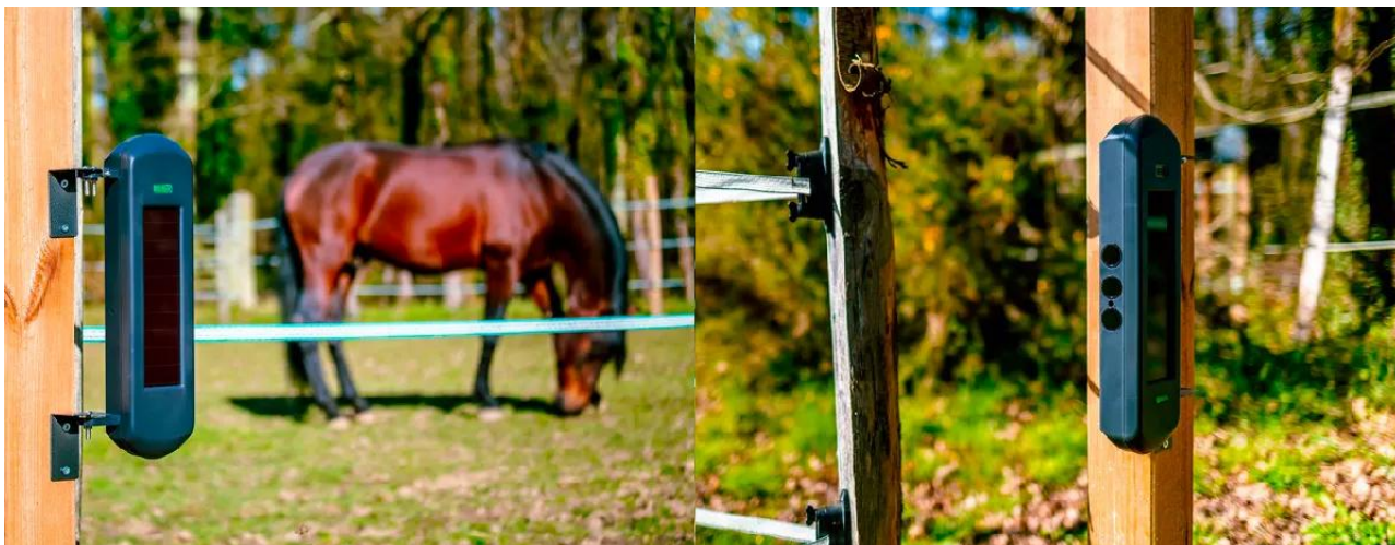
(Exemple d'utilisation de nos barrières 1B afin de sécuriser les paddocks d'un haras)

Les barrières de détections peuvent être écartées de 100 mètres l'une de l'autre. Ici, grâce aux quatre jeux de barrières inclus dans ce système, sécurisez une surface allant jusqu'à 1 hectare de terrain . Assurez-vous d'installer le transmetteur téléphonique KP9 à portée des barrières ( 900 mètres champ libre ) et recevez instantanément des alertes par appel et/ou SMS lorsqu'un des faisceaux infrarouges de détection d'une barrière est coupés par le franchissement d'un individu.